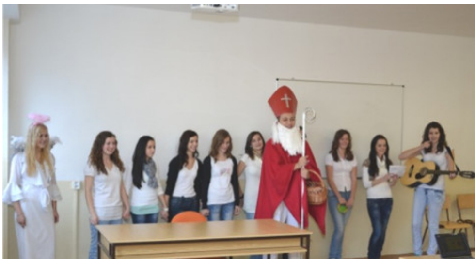
Gymnázium, Slovenská 5