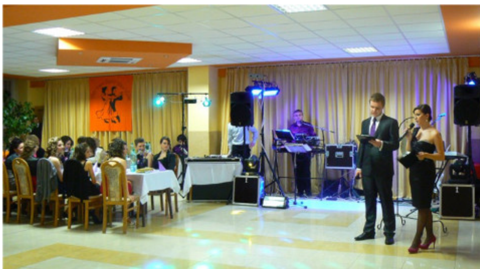
Gymnázium, Slovenská 5