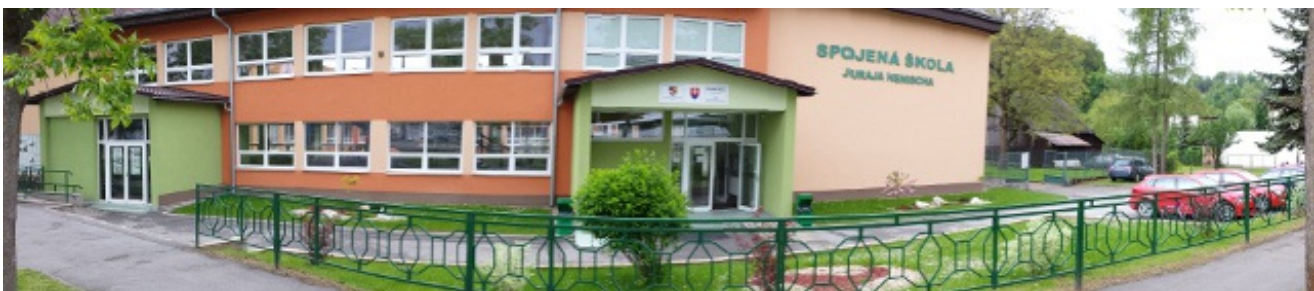
Spojená škola Juraja Henischa, Slovenská 5, Bardejov