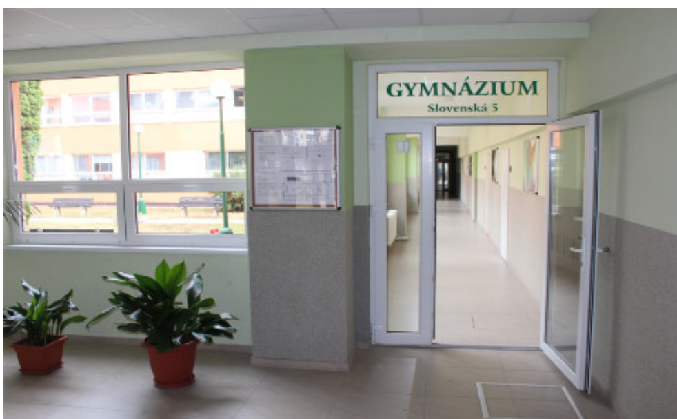
Gymnázium, Slovenská 5

Gymnázium sa výraznejšie oddelilo od odbornej školy, zrenovovalo sa a výučba prebieha samostatne v oddelených priestoroch na prízemí.