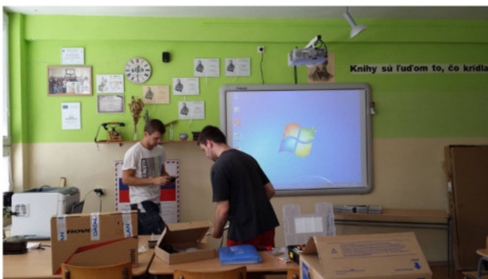
Gymnázium, Slovenská 5