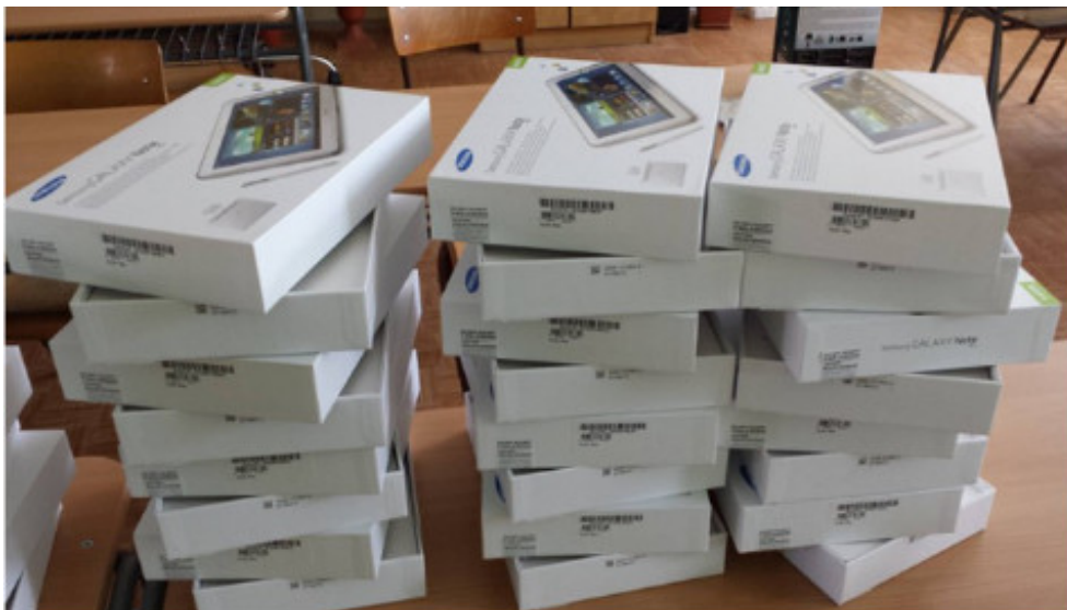
Gymnázium, Slovenská 5