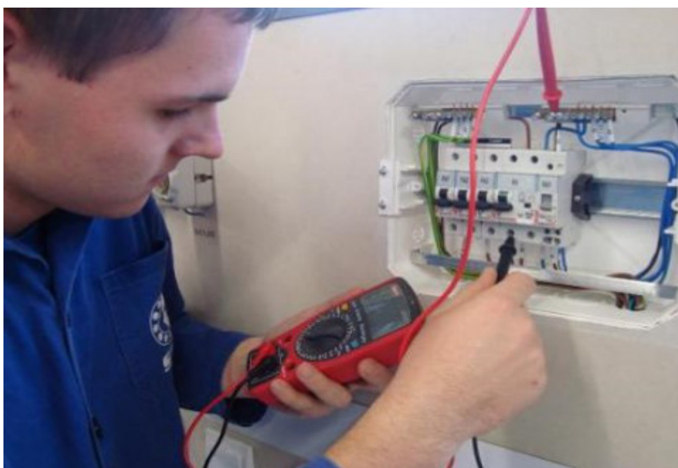
SOŠ polytechnická, mechanik elektrotechnik