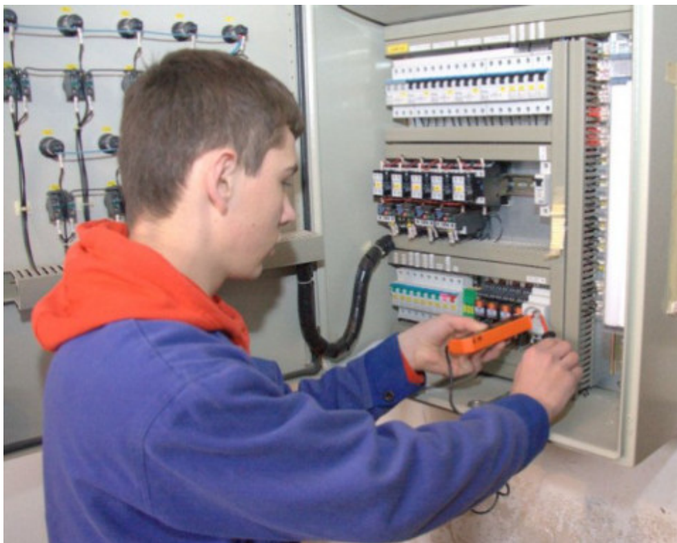
SOŠ polytechnická, mechanik elektrotechnik

Študenti môžu pokračovať v štúdiu na vysokej škole, predovšetkým v oblasti elektrotechniky.